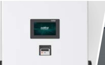
Abbildung in Sonderfarbe mit Folierung der Türen